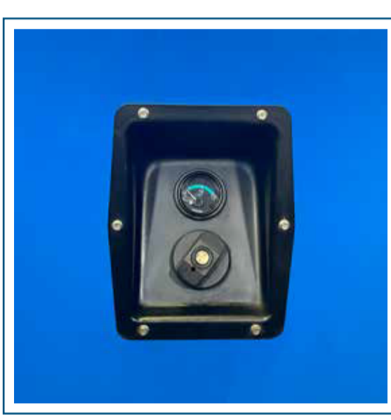
Carga de combustible externa con medidor