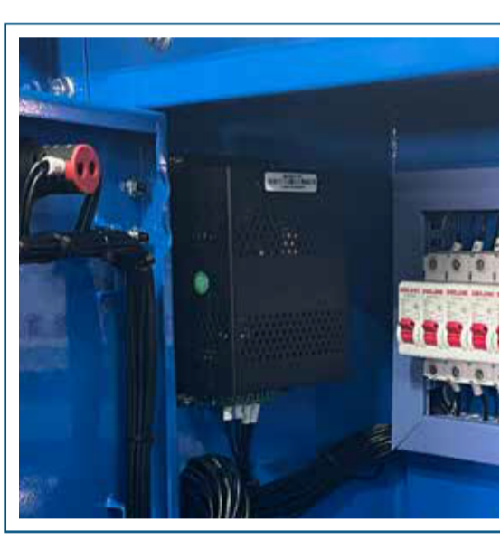
Cargador de batería