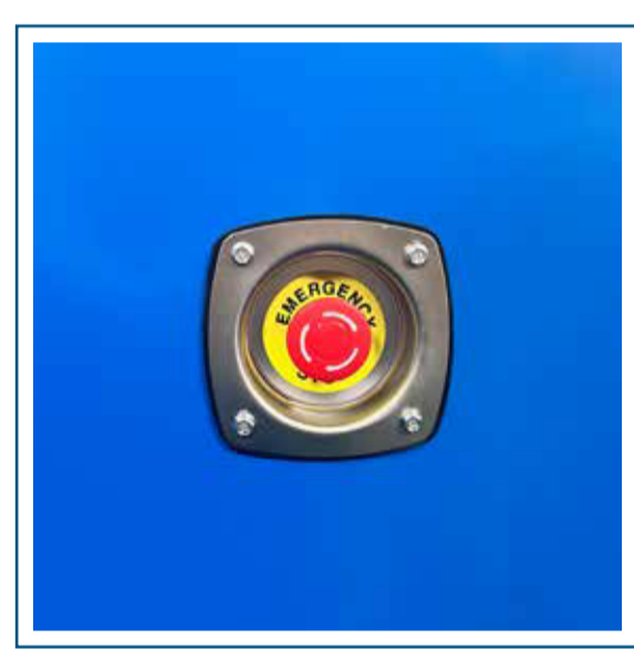
Parada de emergencia