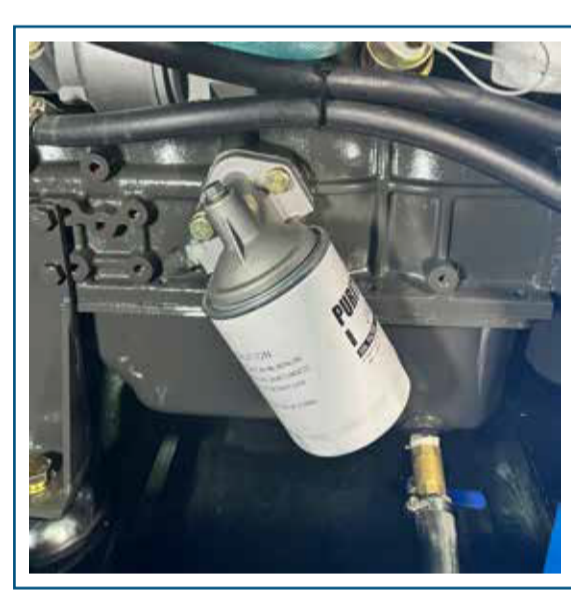
Filtro de aceite