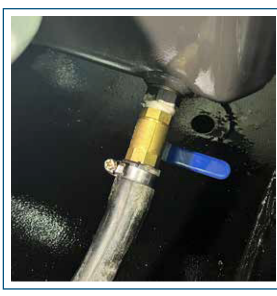
Desagote de aceite motor