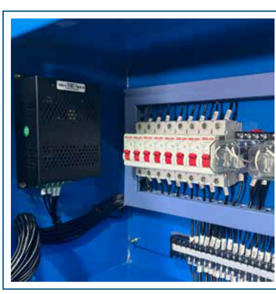
Cargador de batería