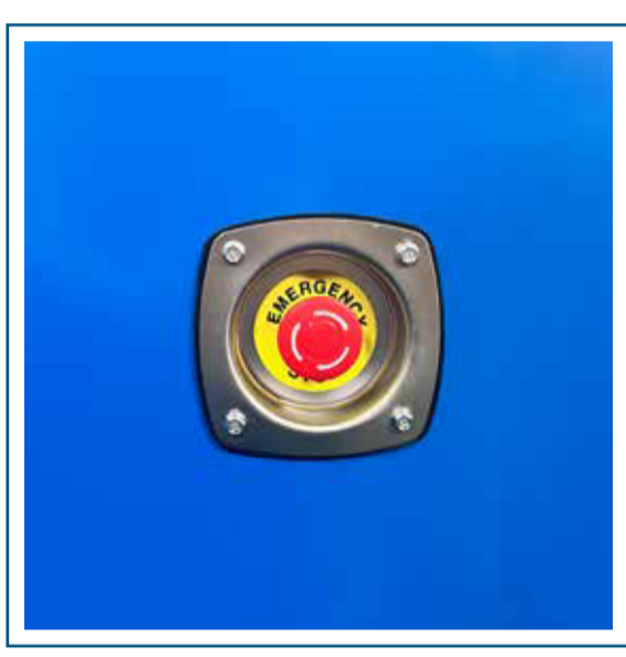
Parada de emergencia