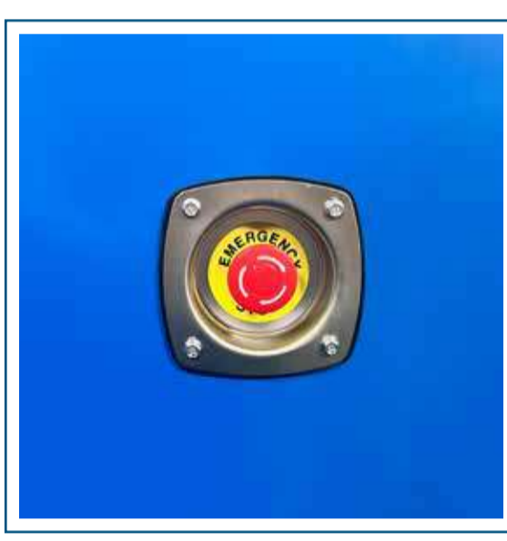
Parada de emergencia