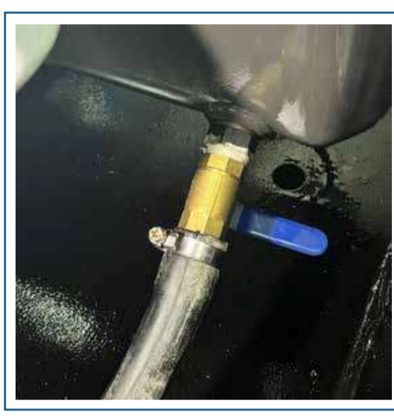
Desagote de aceite motor