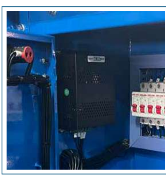
Cargador de batería