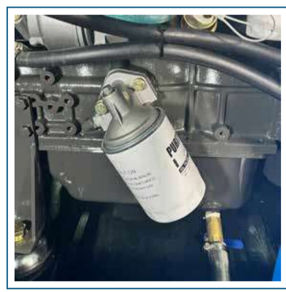
Filtro de aceite